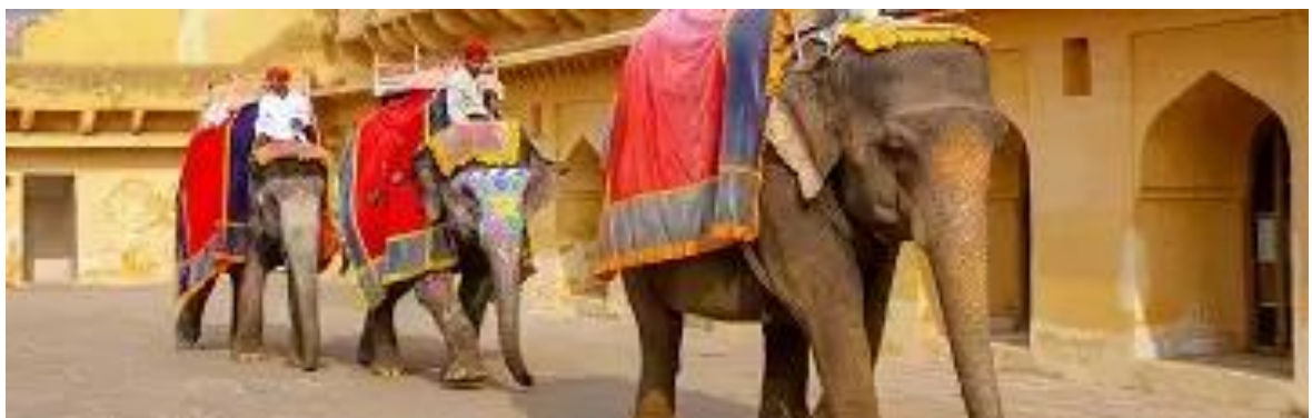
Elefantes del Fuerte Amber a las afueras de Jaipur